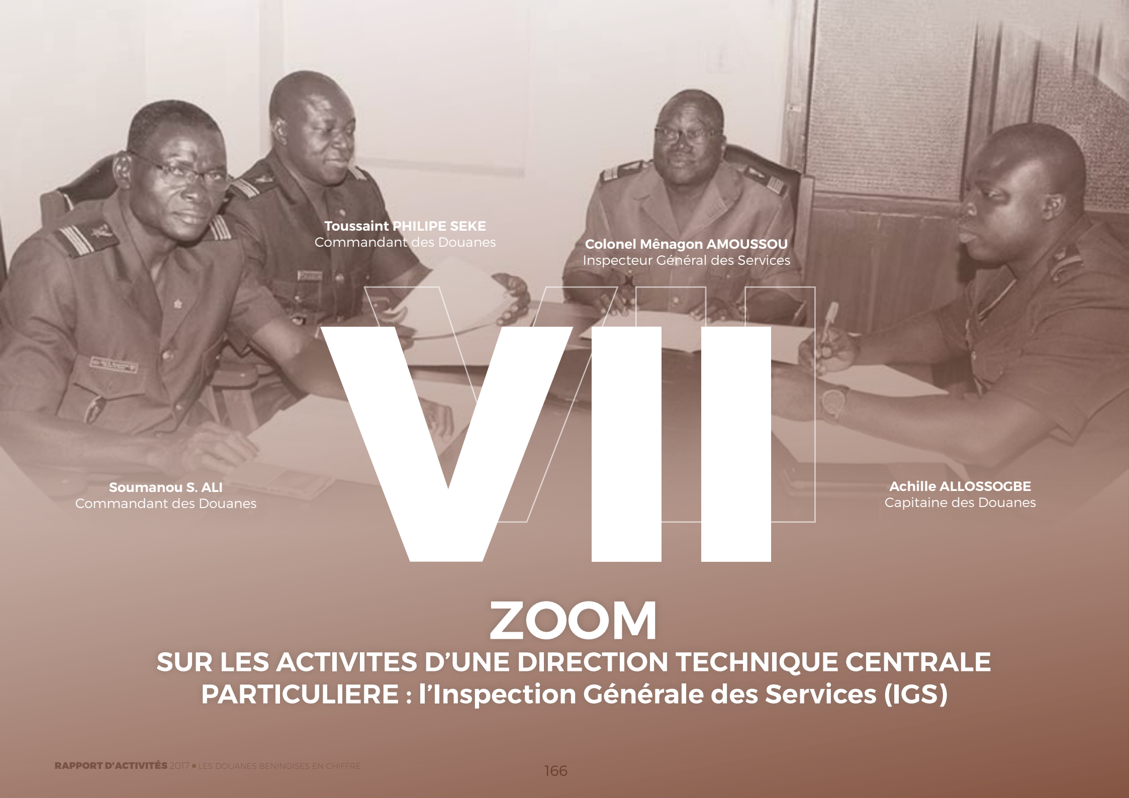
Toussaint PHILIPPE SEKE Commandant des Douanes